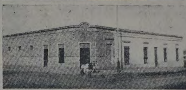
FRENTE DEL AMPLIO EDIFICIO PROPIO DE LA COOPERATIVA DE panadería, de Campana, progresista institución de la que recientemente se ocupó nuestro diario, al referirse a la obra socialista y obrera realizada en esa ciudad. Las instalaciones y elementos para la fabricación del producto, como la amplitud e higiene de las distintas secciones, hacen de la cooperativa que nos ocupa una de las mejores y más modernas entre las de su categoría.